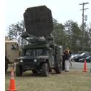
Nicht-tötende Hitzestrahlenwaffe der US-Armee (Active Denial System)

Mit der neuartigen 5G-Technologie dürfte es leicht fallen, Protestbewegungen zu lancieren und Meinungen zu manipulieren. Im äußersten Fall können mit Mikrowellenwaffen demonstrative Aktionen zerstreut werden. Bereits Anfang der 2000er Jahre wurde eine solche Waffe ("Active Denial-System") im hochfrequenten Spektrum von 95 GHz an 13.000 Personen "erfolgreich" getestet. 14 Diese Waffe erzeugt Hitzestrahlen und ist deshalb geeignet, Menschen auf Distanz zu halten.